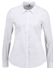
CHEMISE DAME « STAR » BLANCHE