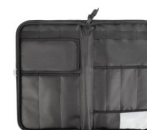
TROUSSE A COUTEAUX