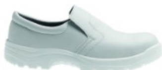
CHAUSSURES DE SECURITE « COOK » S2 BLANCHES