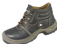
CHAUSSURES DE SECURITE « SHERPA » S3 NOIRES