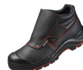
CHAUSSURES DE SECURITE « SOUDEUR » S3 NOIRES