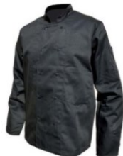
VESTE CHEF « BLAKE » NOIRE 65% POLYESTER — 35% COTON