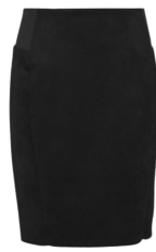
JUPE DE SALLE NOIRE