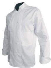
VESTE CHEF « CLASSIC » BLANCHE 65% POLYESTER — 35% COTON

N'hésitez pas à nous contacter au 0486/90.72.69 afin d'organiser une séance d'essayage dans votre établissement