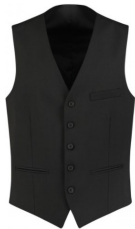
GILET « CARLO » NOIR 100% POLYESTER