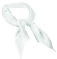
TOUR DE COU BLANC 100% COTON