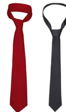
CRAVATE « BARMAN » ROUGE OU NOIRE