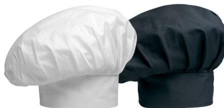
TOQUE CHEF « HAT » BLANCHE OU NOIRE 65% POLYESTER — 35% COTON