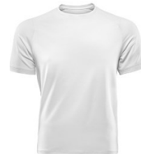
T-SHIRT BLANC 150GR 100% COTON