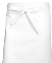
TABLIER « BOULANGER » BLANC 100% COTON — LONGUEUR 55CM