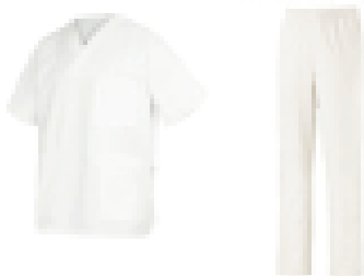
ENSEMBLE MEDICAL « STAGIAIRE » 100% COTON