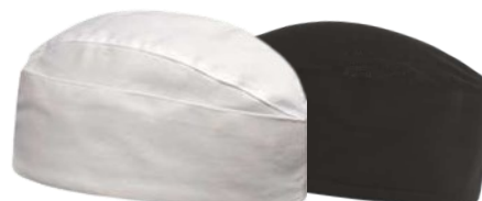
CALOT ALLONGE BLANC OU NOIR 65% POLYESTER — 35% COTON