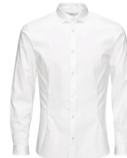
CHEMISE HOMME « OPORTO » BLANCHE